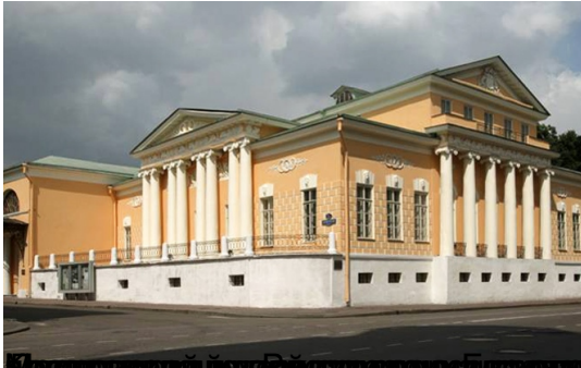
Музей-квартира А. С. Пушкина (ул. Б. Садовая, 28) Дрезденский, где 13