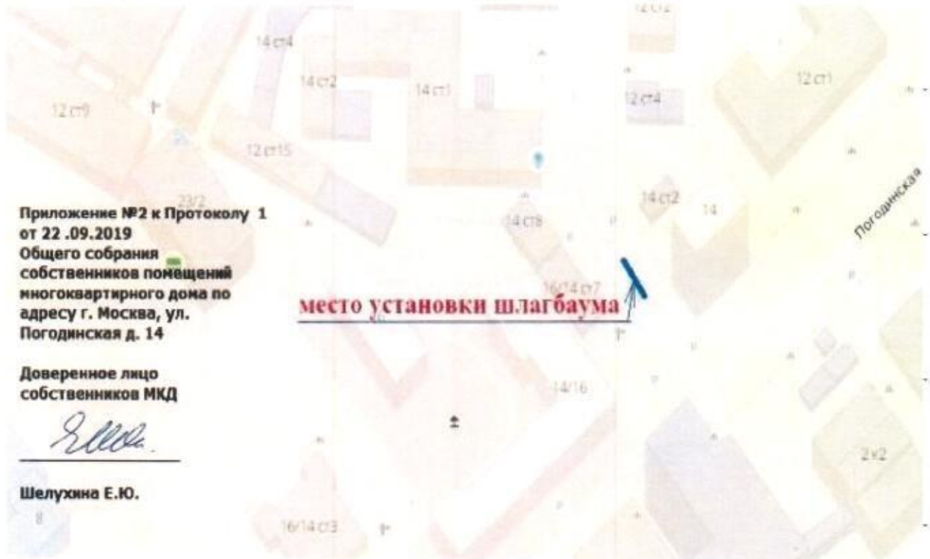
Схема установки шлагбаума на придомовой территории многоквартирного дома, расположенного по адресу: Погодинская ул., д.14

Приложение к решению Совета депутатов муниципального округа Хамовники от 14 ноября 2019 года № 16/11