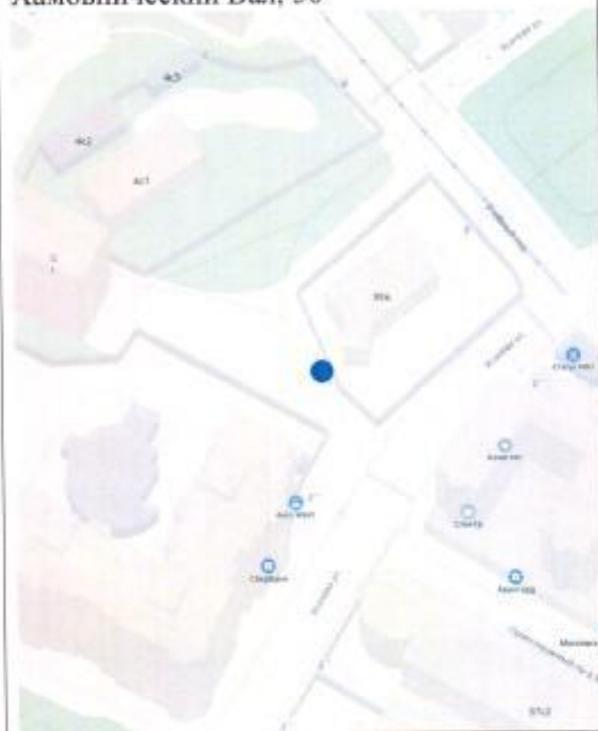
Схема 3 – Проход от улицы Усачёва наискосок к Учебному переулку между домами Усачёва улица, 35А и улица Хамовнический Вал, 36