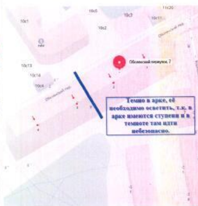
Схема 2 - Оболенский пер. 7