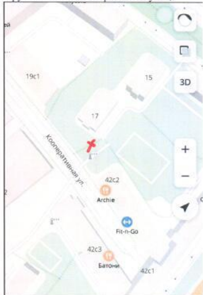
Схема 7 - Проход от дома 17 по 3-ей Фрунзенской к Кооперативной улице