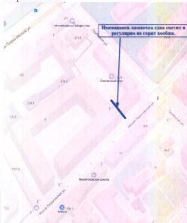
Схема 6 - Арка между домом 6/4 и домом 8 (Барринхаус) по Малой Пироговской