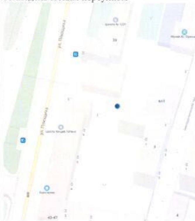
Схема 5 - Проход между ул. Плющиха и Земледельческим переулком