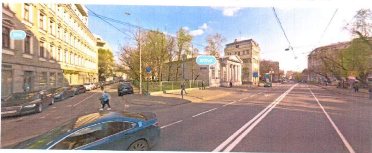
Фото фиксация 2018г. (Яндекс карты. Просмотр улиц и фотографии)

Фото фиксация 2015г. (Яндекс карты. Просмотр улиц и фотографии)