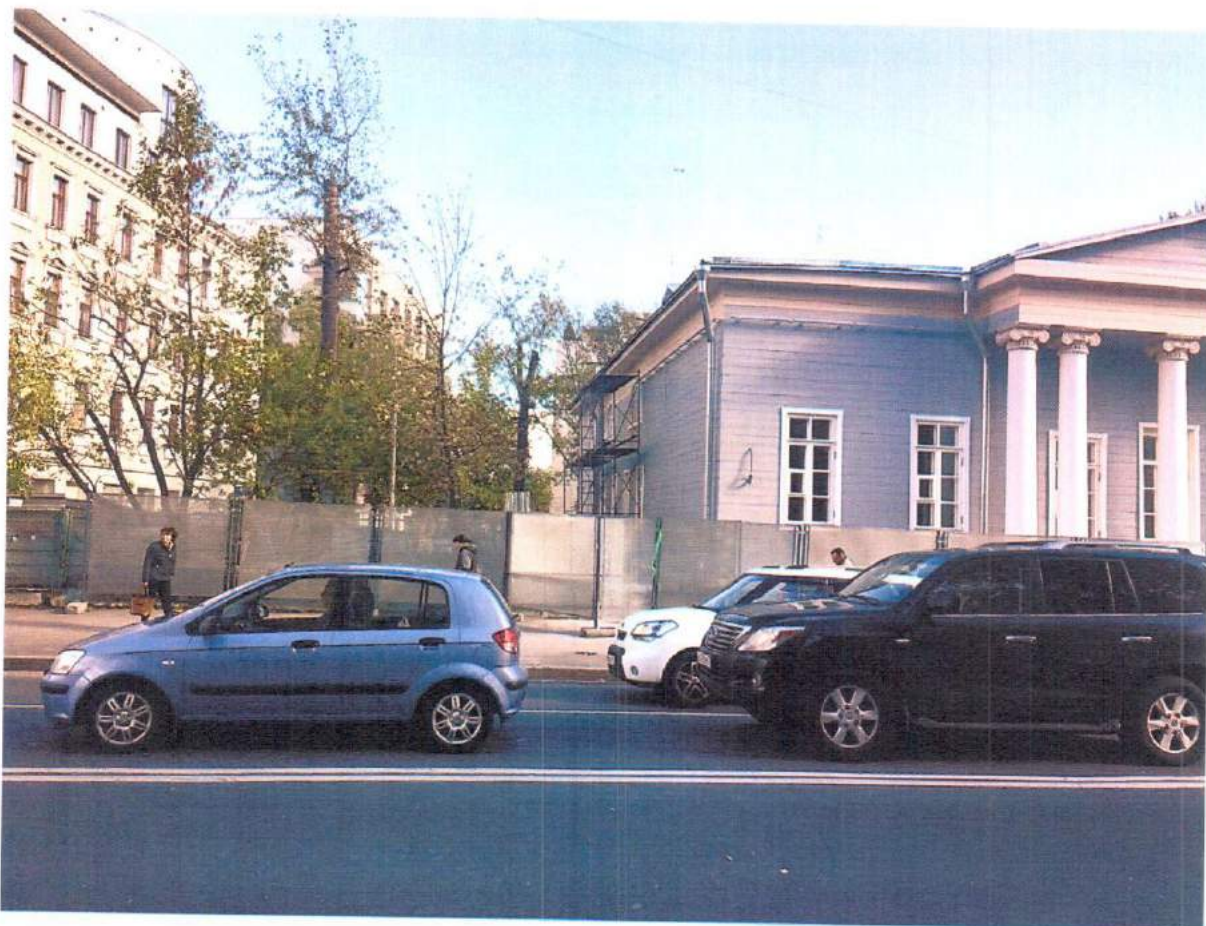
Фотофиксация 16 октября 2018г.