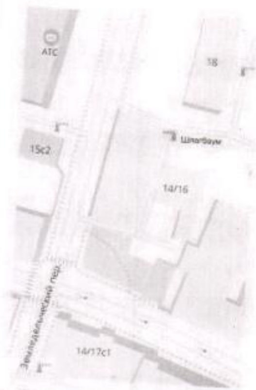
Рис. 2 - Расположение шлагбаума на карте