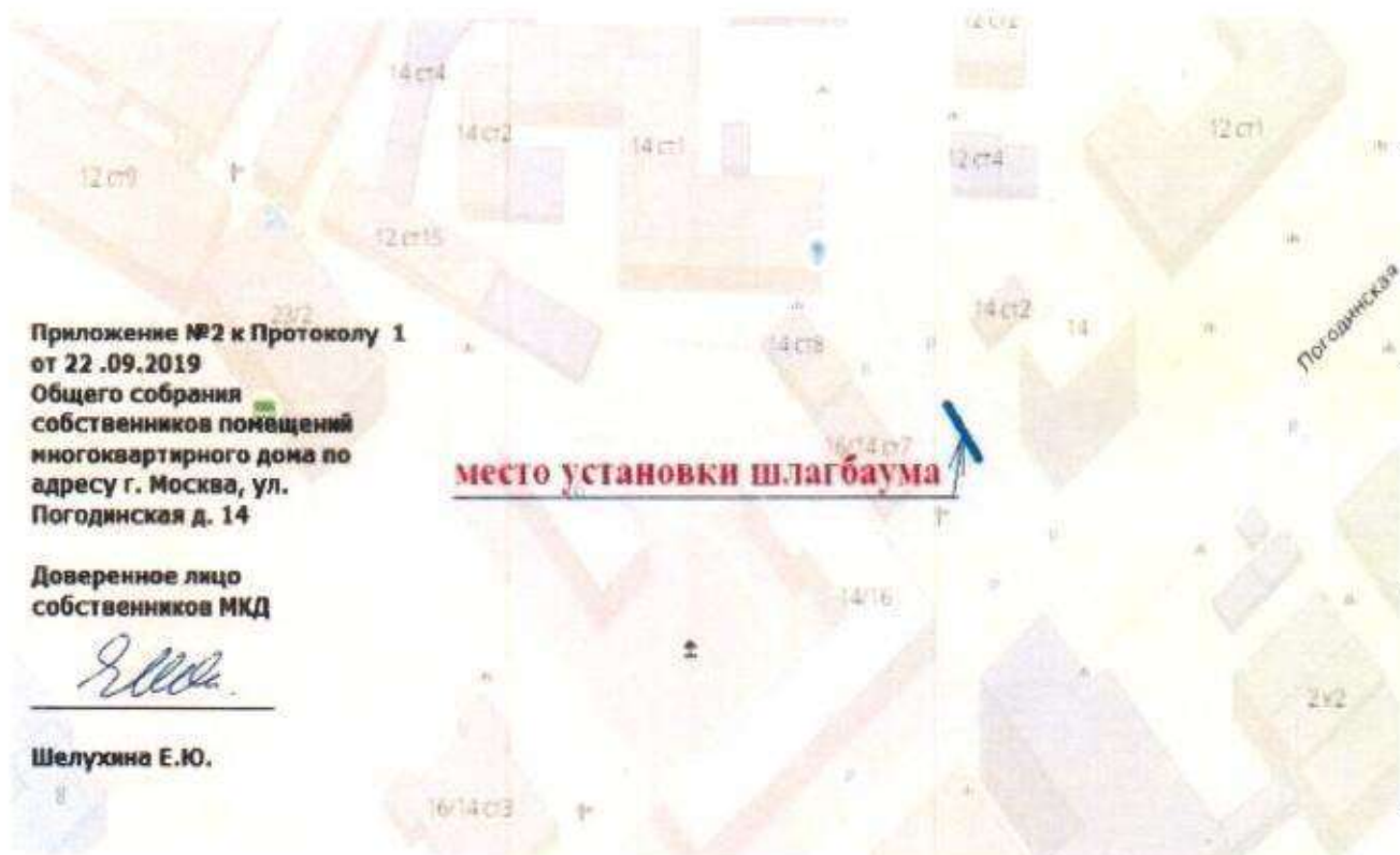
Схема установки шлагбаума на придомовой территории многоквартирного дома, расположенного по адресу: Погодинская ул., д.14

Приложение к решению Совета депутатов муниципального округа Хамовники от 14 ноября 2019 года № 16/11